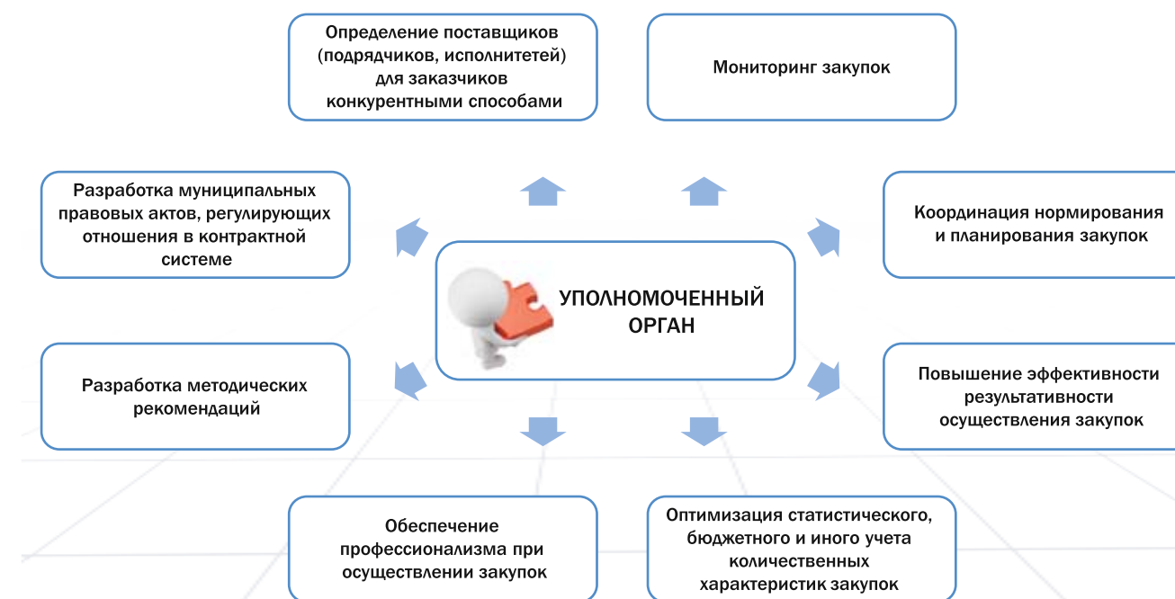
Рисунок 4. Функции управления муниципального заказа.

сударственной политики в сфере закупок (Рис. 1). При этом полномочия муниципалитетов в данном направлении не прописаны (Рис. 2). В результате мы получили отсутствие вертикально интегрированных систем стратегического управления контрактными системами в субъектах и муниципалитетах Российской Федерации (Рис. 3). В этой связи